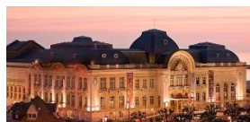
Les Planches de Trouville